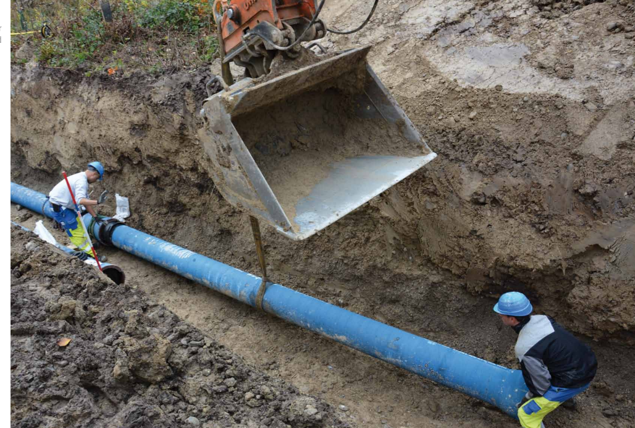
Arbeiten an der Transportleitung Schlund

Die Gemeinde wollte mit dem Deckbelagseinbau in der Unterhuebstrasse auch den Bereich des Sennhofweges miterneuern. Daher mussten vorgängig die alten Wasser- und Gasleitungen ersetzt werden.