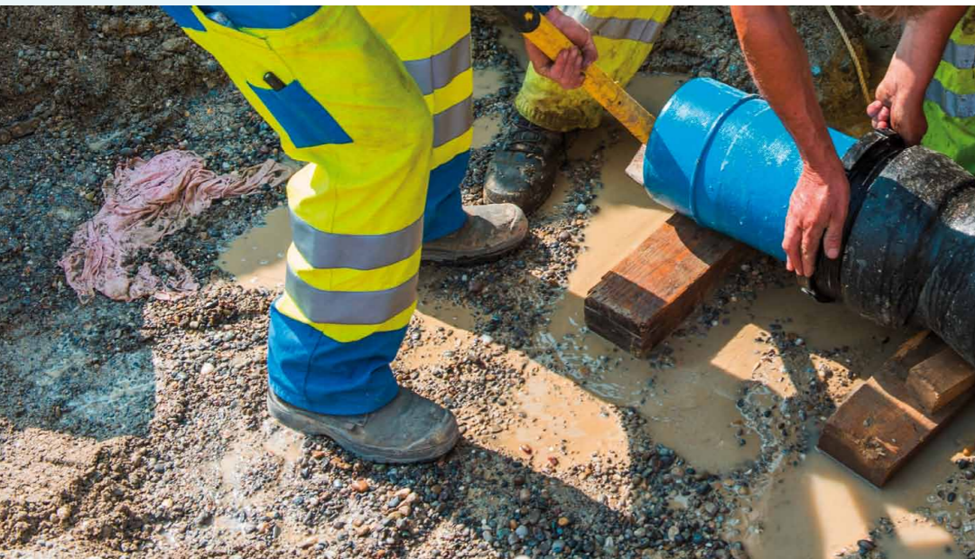
Reparatur eines Rohrbruches

Erläuterungen: PE = Polyethylen GD = Guss duktil NW = Nennweite