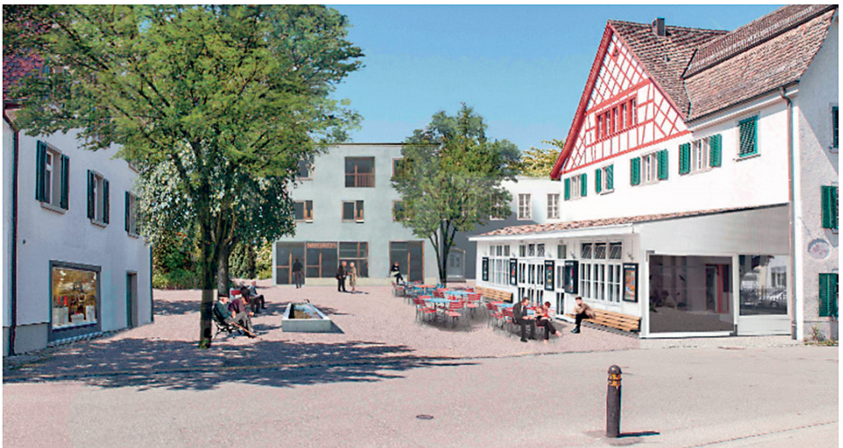
Mögliche Platzgestaltung (Bild aus der Machbarkeitsstudie)

Im April 2016 wurden der Entwurf der Umzonungsvorlage und der Entwurf des Gestaltungsplans öffentlich aufgelegt. Parallel dazu wurde eine Ausschreibung für den Grossverteiler durchgeführt. Mit diesem Schritt wurde sichergestellt, dass alle interessierten Baurechtnehmer bei der Offertstellung über die gleichen Voraussetzungen verfügten. Bei der Ausschreibung für den Grossverteiler machte Coop das Rennen. Dank diesem Vertrag, der dem künftigen Baurechtnehmer überbunden wird, wussten die interessierten Baurechtnehmer, dass die Einnahmen aus der Vermietung der Ladenfläche im Untergeschoss mindestens 1,45 bis 1,9 Mio. Franken jährlich betragen werden, und sie konnten ihre Offerten entsprechend kalkulieren. Bei der Auswertung der Offerten zeigte sich, dass dank dieser gesicherten Einnahmen die Wohnungsmieten deutlich günstiger werden können.