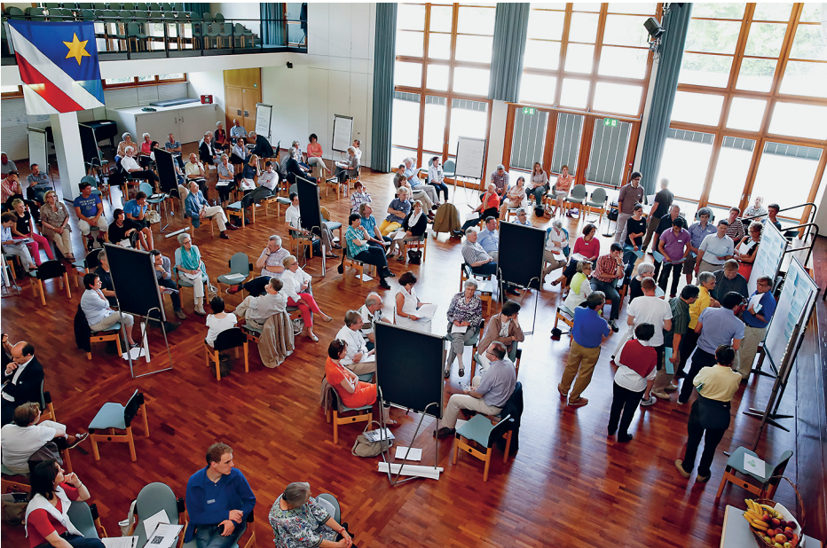
Öffentliche Planungswerkstatt vom 8. Juni 2013

Mit dem Neubau des Wohn- und Pflegezentrums am Blumenrain wurde das Areal Beugi mitten im Ortskern für eine neue Nutzung frei. 2013 wurde die Diskussion zur Entwicklung dieser Parzelle mitten im Ortskern von Zollikon mit einer Planungswerkstatt, an der alle interessierten Zollikerinnen und Zolliker teilnehmen konnten, eröffnet. Dabei wurde klar, dass sich die Planung nicht nur auf das frei werdende Grundstück Beugi konzentrieren darf, sondern die Entwicklung des gesamten Ortskerns und die Interessen und Bedürfnisse der ganzen Bevölkerung im Auge behalten werden müssen.