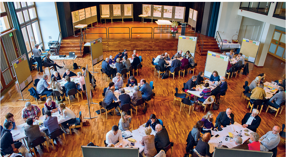
Öffentliche Diskussion zur Entwicklung des Areal Beugi vom 14. März 2015

Aufgrund dieser Kriterien entschied sich der Gemeinderat für die Baugenossenschaft Zurlinden. Diese Baugenossenschaft wurde 1923 gegründet und besitzt heute 1650 Wohnungen in Zürich und der Umgebung. Sie ist der Gemeinnützigkeit verpflichtet und kann somit Wohnungen zu langfristigen günstigen Mietzinsen (Kostenmiete) anbieten.