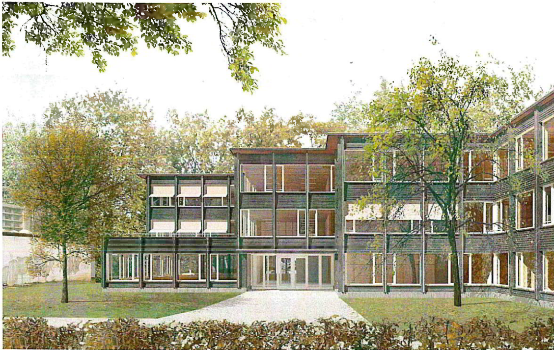
Projekt Tripp Trapp, Ansicht von Südwest, Visualisierung

Das Preisgericht nahm die Rangierung vor und empfahl einstimmig das Projekt "Tripp Trapp" (Architektur: Bienert Kintat Architekten, Zürich) zur Weiterbearbeitung.