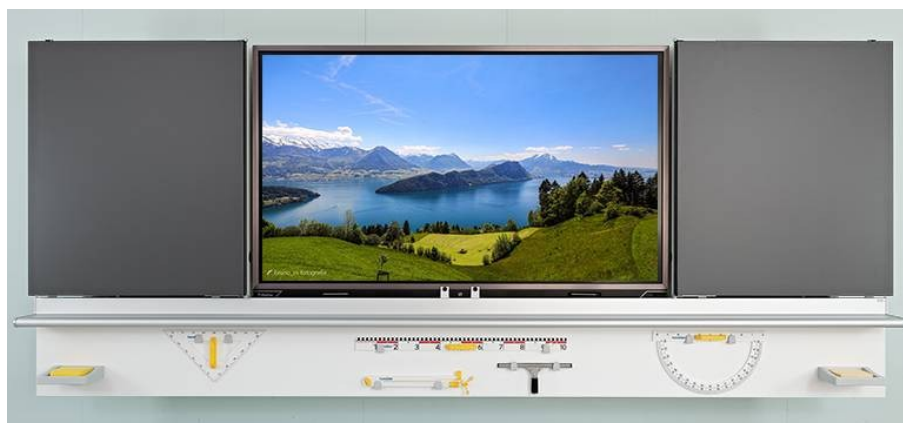
Abb. 2

Visualisierung einer möglichen Lösung mit integriertem Display in einer 7-seitigen Wandtafel (Abbildung 2)